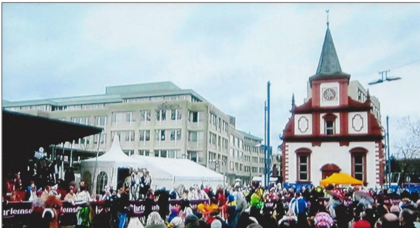
In der Mitte des Geschehens: Fernsehübertragung aus Offenbach, Fastnachtszug am 2. Februar 2020 vor der Französisch-Reformierten Kirche.

Im Mittelpunkt des närrischen Geschehens und Treibens die altehrwürdige Französisch-Reformierte Kirche. „Offebach Hallau!“