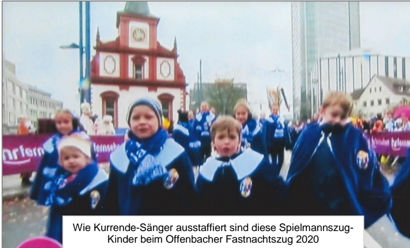
Wie Kurrende-Sänger ausgestattet sind diese Spielmannszug-Kinder beim Offenbacher Fastnachtszug 2020

Mit mehr als 100jähriger Tradition gab es bis 1960 Fastnachtszüge in Offenbach am Main. Seit dem finden nur noch Jubiläumsumzüge statt. So in diesem Jahr zur Feier von 6 x 11 Jahre „Bürgeler Akte“ am 02.02.2020.