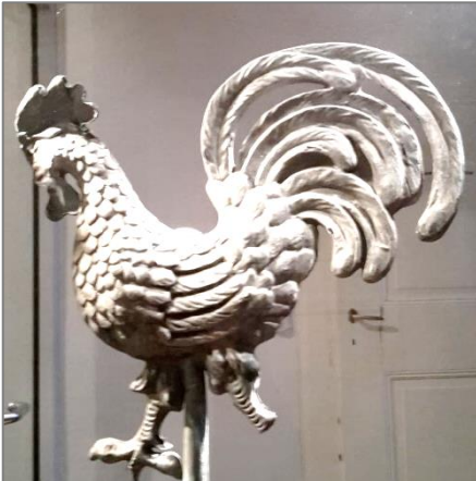
„Le Coq“, der Gockel im Ruhestand steht jetzt, wie in einer Vitrine, im Foyer vor dem Gemeindebüro, Herrnstraße 66