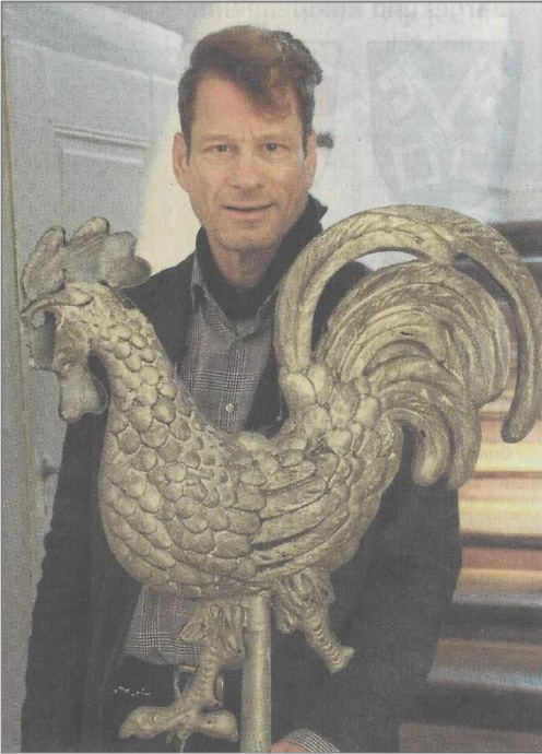
Pfarrer im Dienst, Turmhahn im Ruhestand