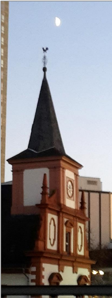
Der Turmhahn, der Mond und die Sterne, hier über der Franz.-Ref. Kirche mitten in Offenbach, der Stadt des Wetters, des Leders und der Lettern.

Doch da rettet der Pfarrer ihn, „den alten Kirchendiener“, vor der Verschrottung durch den Hufschmied. Er wird unter Freudengeschrei der Kinder ins Amtszimmer des Pastors gebracht.